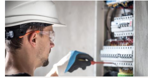
Prévention des Risques Électriques (PRE)