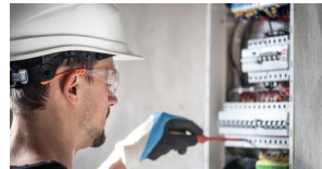
Prévention des Risques Électriques (PRE)