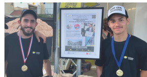
Excellence des métiers