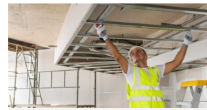
Travail en hauteur sur échafaudages de pied (R408)