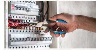
Habilitation Electrique B1V