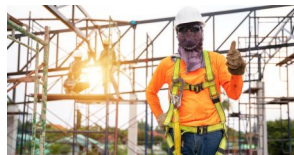
Santé Sécurité au Travail (SST)