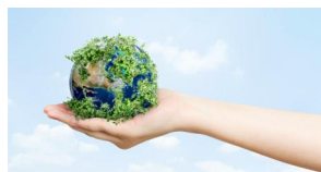
Prévention-santé- environnement (PSE)