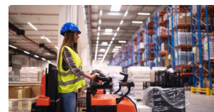
Prévention des Risques liés à l'Activité Physique (PRAP)