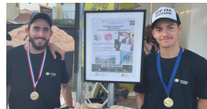
Excellence des Métiers