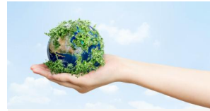
Prévention-Santé- Environnement (PSE)