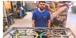
Excellence des Métiers