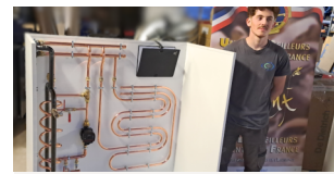
Excellence des Métiers