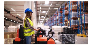
Prévention des Risques liés à l'Activité Physique (PRAP)