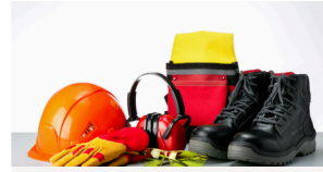
Santé Sécurité au Travail (SST)