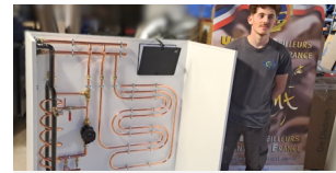
Excellence des Métiers