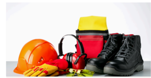
Santé Sécurité au Travail (SST)