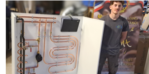
Excellence des Métiers