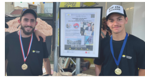
Excellence des Métiers